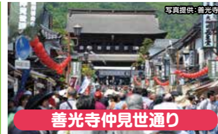
善光寺仲見世通り

申込期間 5月15日(日)~5月20日(金) 申込方法 本店・胎内店にてお申込書をお預かり致します 抽選日 5月25日(水) 抽選結果案内 5月27日(金)にご連絡致します 旅行実施可否決定 6月10日(金) ※実施可能の場合: 座席表を送付致します ※実施不可の場合: ハガキにてご案内致します