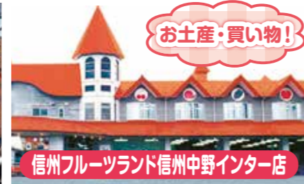
信州フルーツランド信州中野インター店

旅行企画・実施 新潟県知事登録旅行業 第2-364号 大滝観光 旅日記 大滝自動車工業株式会社 総合旅行業務取扱管理者 長 正人 村上市仲間町639-46 ☎0254-62-7789