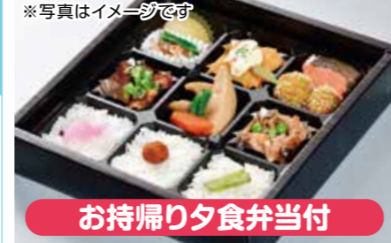
お持帰り夕食弁当